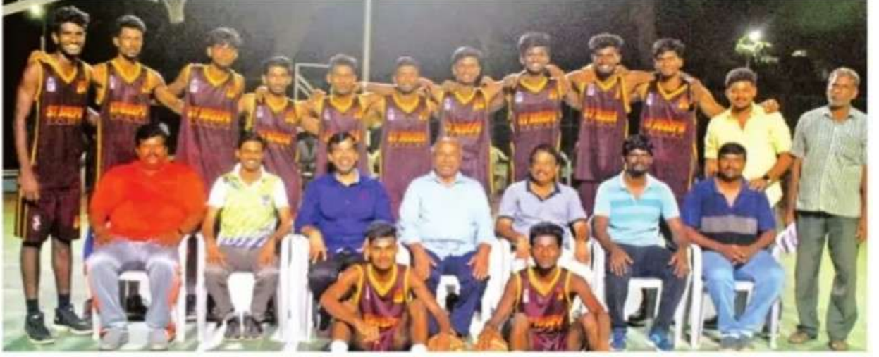
ஆடவர் கூடைப்பந்து போட்டியில் வெற்றி பெற்ற ஜோசப் கல்லூரி அணியுடன் கல்லூரி நிர்வாகிகள்.

திருச்சி டிச. 14: திருச்சியில் நடைபெற்ற கல்லூரிகளுக்கு இடையிலான கூடைப்பந்தாட்டப் போட்டிகளில் ஜோசப் கல்லூரி அணி முதல் இடம் பிடித்தது.