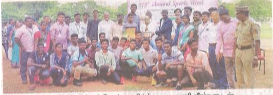
சாம்பியன் பட்டம் வென்ற தமிழ்த் துறை அணி வீரர்களுடன் தூய வளனார் கல்லூரி நிர்வாகத்தினர்.

திருச்சி, செப். 7: தூய வளனார் கல்லூரியின் 179ஆவது ஆண்டு விளையாட்டுப் போட்டியில் ஒட்டுமொத்த சாம்பியன் பட்டத்தை தமிழ்த் துறை அணி வென்றது.