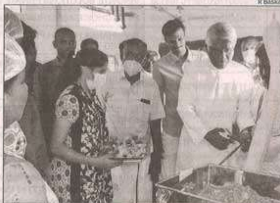
EMPOWERING FARMERS: The moringa value-added powder production unit was opened at Nagamangalam in Trichy

The project was taken up as part of eradicating malnutrition from villages, ma-