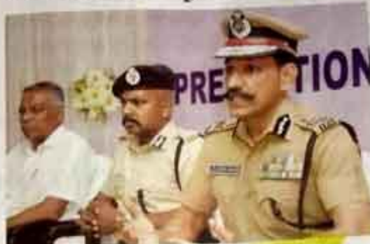
Director General of Police C. Sylendra Babu chairing a symposium at St. Joseph's College in Tiruchi on Saturday.

Based on this, Mr. Babu said, the State police had formulated a plan of action to ensure zero deaths in police custody. To achieve the goal, it had been decided to reach out to about 1.13 lakh policemen in the State so as to sensitise them on the prevention of custodial deaths in police stations. They would be given special training on