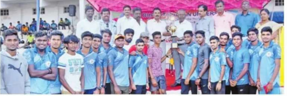
மாணவர்கள் பிரிவில் சாம்பியன் பட்டம் வென்ற செமின்ட் ஜோசப் கல்லூரி அணி. உடன், கல்லூரி நிர்வாகிகள்.

திருச்சி.டிச.19:திருச்சியில் நடைபெற்ற பல்கலைக்கழக 39 ஆவது தடகளப் போட்டிகளில் திருச்சி ஜோசப் கல்லூரி ஆண்கள் பிரிவிலும், தேசியக் கல்லூரி மாணவிகள் பிரிவிலும் சாம்பியன் பட்டத்தை தட்டிச் சென்றன.