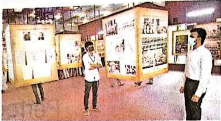
Visitors looking at the exhibits in the Heritage Museum in Tiruchi on Wednesday. • M. MOORTHY

The college shifted to Tiruchi in 1883, from where it continues to function in its heritage campus in the Chathiram area. Former Pre-