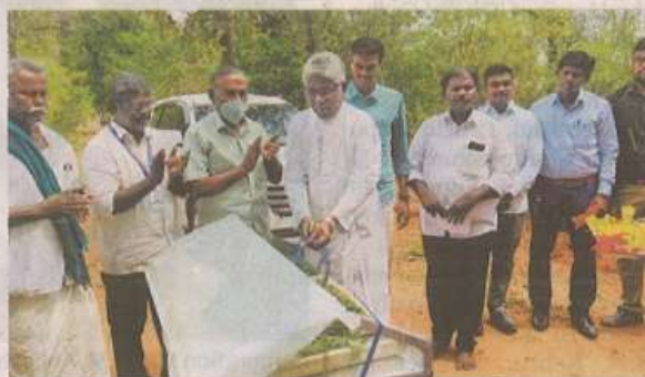
The unit to manufacture moringa value-added products was inaugurated by St. Joseph's College staff and officials at the herbal garden in Nagamangalam.

Through the programme, which is part of the Unnat Bharat Abhiyan (UBA) scheme under the aegis of the Ministry of Human Resource Development, the college's SHEPHERD extension department will adopt five villages in a bid to eradicate malnutrition and also